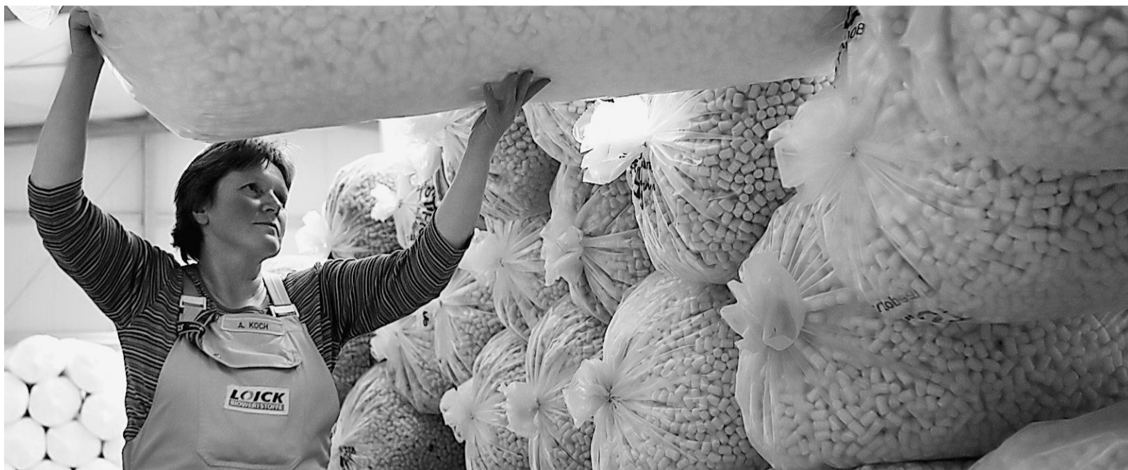
Eine Mitarbeiterin der Corn Pack GmbH & Co KG, sortiert im Werk Teterow Säcke mit „Playmais“, einem Naturprodukt aus Mais, das zu Kinderspielzeug weiterverarbeitet wird. Die

Corn Pack GmbH & Co KG in Teterow (Landkreis Güstrow) gilt nach eigenen Angaben als deutschlandweit größter Hersteller von Bio-Wegwerfgeschirr. Das Unternehmen will seine